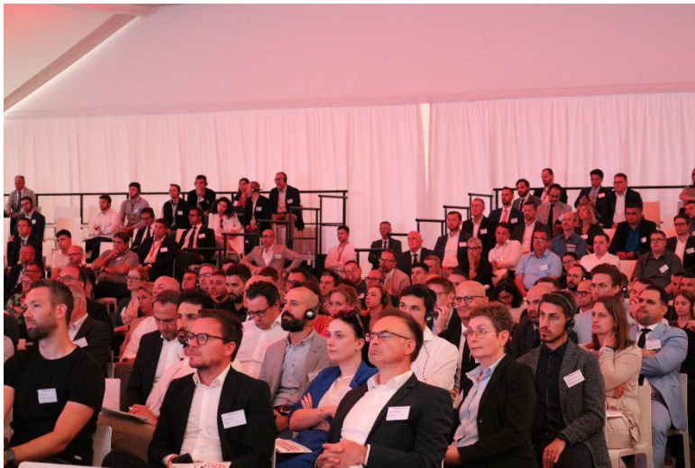
Bild 1: Fachforum C-Teile-Management 2023.jpg

Bildunterschrift 1: Fachforum C-Teile-Management 2023