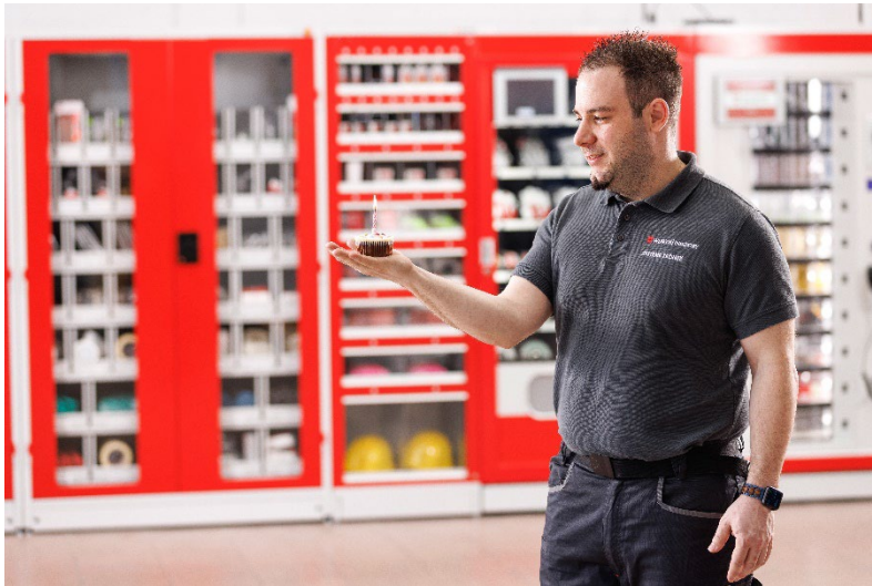
Bild 1: 10 Jahre Jubiläum ORSY@mat.jpg

Bildunterschrift 1: 2023 feiert die Würth Industrie Service 10-jähriges Bestehen der ORSY@mat Ausgabesysteme.